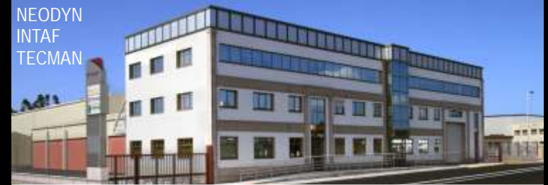
SINCRO MECÁNICA EVOLVENTIA